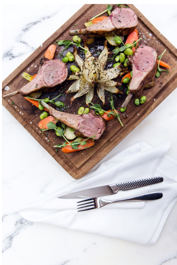
复活节主菜选择 - 烤羊鞍